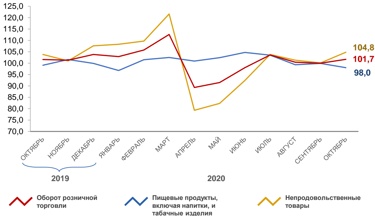
Динамика оборота розничной торговли (в процентах к соответствующему периоду предыдущего года)

В ЯНВАРЕ-ОКТАБРЕ 2020 ГОДА оборот розничной торговли составил 467541,8 млн. рублей, или 100,6% к январю-октябрю 2019 года в сопоставимых ценах