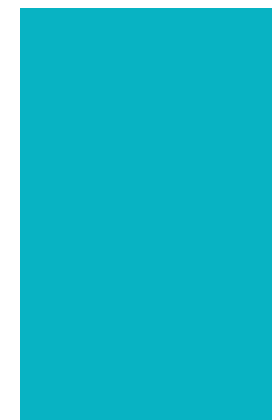
Педагоги дошкольного образования